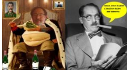
MORT AUX CONS

Ah voila j'ai compris ! c'est un manque de potassium ! Il faut donc que je potasse le bouquin !!!!